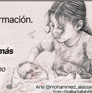
Arte @mohammed_alsassar

– Refaat Alareer, Escritor palestino Asesinado por Israel el 6 de diciembre de 2023