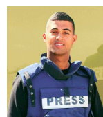
📷 hossam_shbat Asesinado en Marzo 24, 2025. Cuenta todavía administrada por su equipo